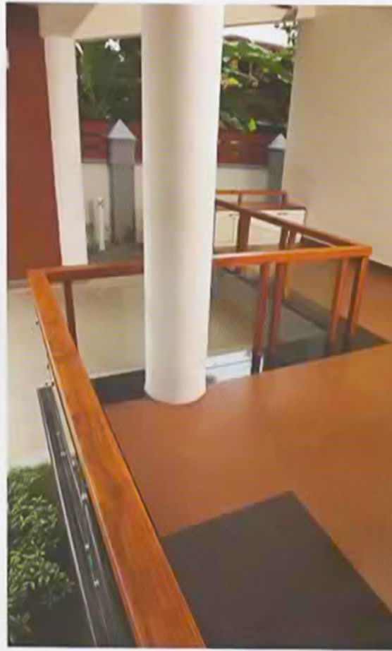
വുഡ് - ഗ്രാസ്സ് ഹാൻഡ് റെയിലുകൾ സിറ്റൗട്ടിനെ അലങ്കരിക്കുന്നു.