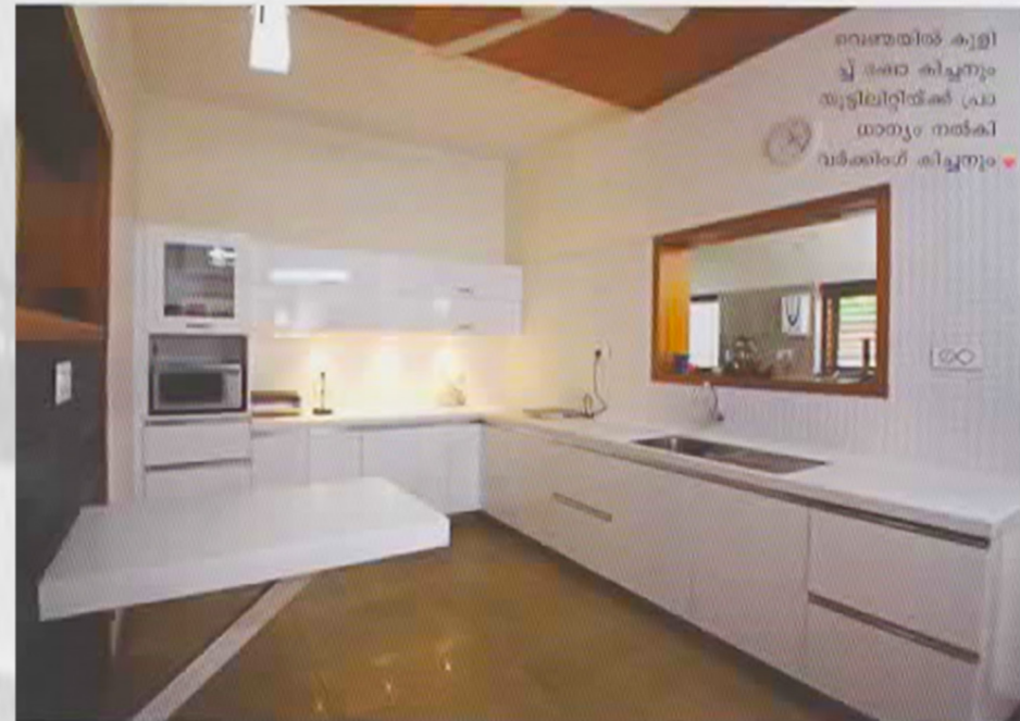
വെള്ളയിൽ കുളിച്ച് ഭക്ഷണവും യൂട്ടിലിറ്റികൾ പ്രാധാന്യം നൽകി വർക്കിംഗ് കിച്ചനും

ആറു ബെഡ്റൂമുകൾ ഇവിടെയുണ്ട്. വീട്ടി കൊണ്ടു നിർമ്മിച്ച വലിയ കട്ടിലാണ് മാസ്റ്റർ ബെഡ്റൂമിന്റെ ഹെഡ്ബെഡ്. ജിപ്സംവുമാണ് ബെഡ്റൂമിന്റെ ഉപയോഗിച്ച് സീലിംഗും അലങ്കരിച്ചിട്ടുണ്ട്. വുഡൻ കളരിലും വൈറ്റ് കളരിലുമുള്ള വിടിഫൈഡ് ടൈലുകളുടെ കോമ്പിനേഷനാണ് ഫ്ലോറിൽ പരിഷ്കരിച്ചിരിക്കുന്നത്. പ്രത്യേകം ഡ്രസ്സിംഗ് ഏരിയയും ഇവിടെ നൽകിയിട്ടുണ്ട്. ഡ്രസ്സിംഗ് ഏരിയയ്ക്കും ബെഡ് ഏരിയയ്ക്കും ഇടയിലായി വൃദ്ധ് ഉപയോഗിച്ച് ഒരു പാർട്ടീഷ്യനും നൽകിയിട്ടുണ്ട്. പ്രൈവറ്റ് ലിവിംഗ് ഏരിയയും ഈ ബെഡ്റൂമിന് അകമ്പടിയവുന്നുണ്ട്. ക്ലസ്റ്റ് ഡിസൈനില്ലുള്ള ഒരു ഹാംഗിംഗ് ലൈറ്റ് ലിവിംഗ് ഏരിയയിൽ പ്രഭ ചൊരിയുന്നു. മാസ്റ്റർ ബെഡ്റൂമിന്റെ അറ്റാച്ച്ഡ് ബാത്ത് റൂമും വിശാലമാണ്. ഡ്രൈ, വെറ്റ് ഏരിയകളെ പ്രത്യേകം വേർതിരിച്ച ഈ ബാത്ത് റൂമിൽ ലീഡ് ഡിസൈനില്ലുള്ള ടൈൽ ഉപയോഗിച്ച് വാൾ ക്ലാസ്സിംഗ് നൽകിയിട്ടുണ്ട്.