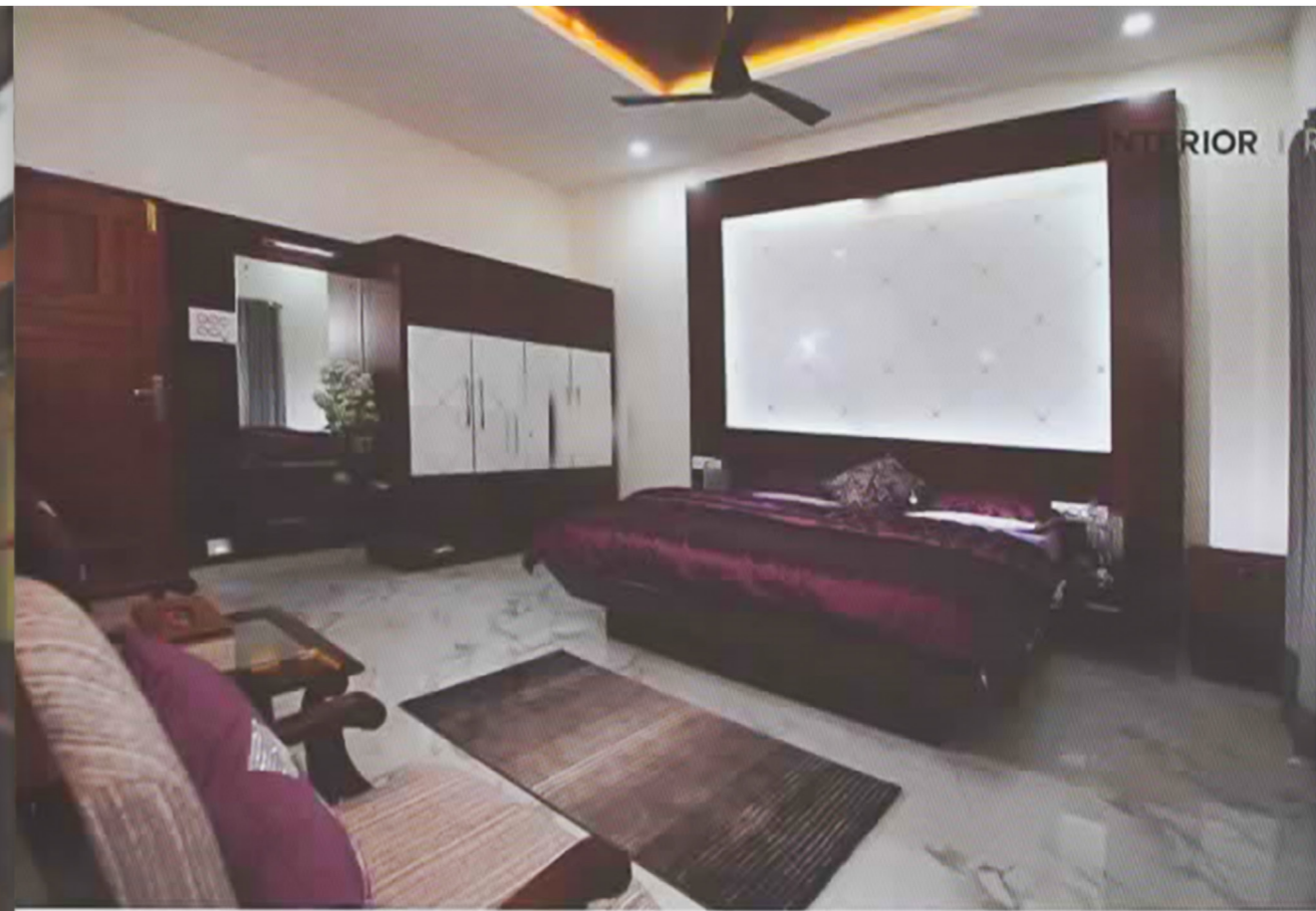
ഡിസൈനിന്റെ വൈവിധ്യവും നിമിത്തവും മേമ്പൽ റൂമുകളെ വിട്ടുകൊടുക്കേ പ്രിയപ്പെട്ട ഇമോഷൻ മാറ്റുന്നു.

ന്ന എസ് എസും വ്യത്യസ്തമായ ഉപയോഗിച്ചു നിർമ്മിച്ച പാർട്ടീഷൻ വാളിലും ഷഡ്ജാകൃതി ആവർത്തിക്കപ്പെടുന്നു. ഷെൽഡ് വെനിറ്റും ഉപയോഗിച്ചാണ് സൈഡ് ടേബിളുകളും ടീപോയും എല്ലാം ഒരുക്കിയിരിക്കുന്നത്. സീലിംഗിലെ ബീമിനെയും ഷെൽഡ് വെനിറ്റും ഉപയോഗിച്ച് കവർ ചെയ്തെടുത്തിട്ടുണ്ട്.