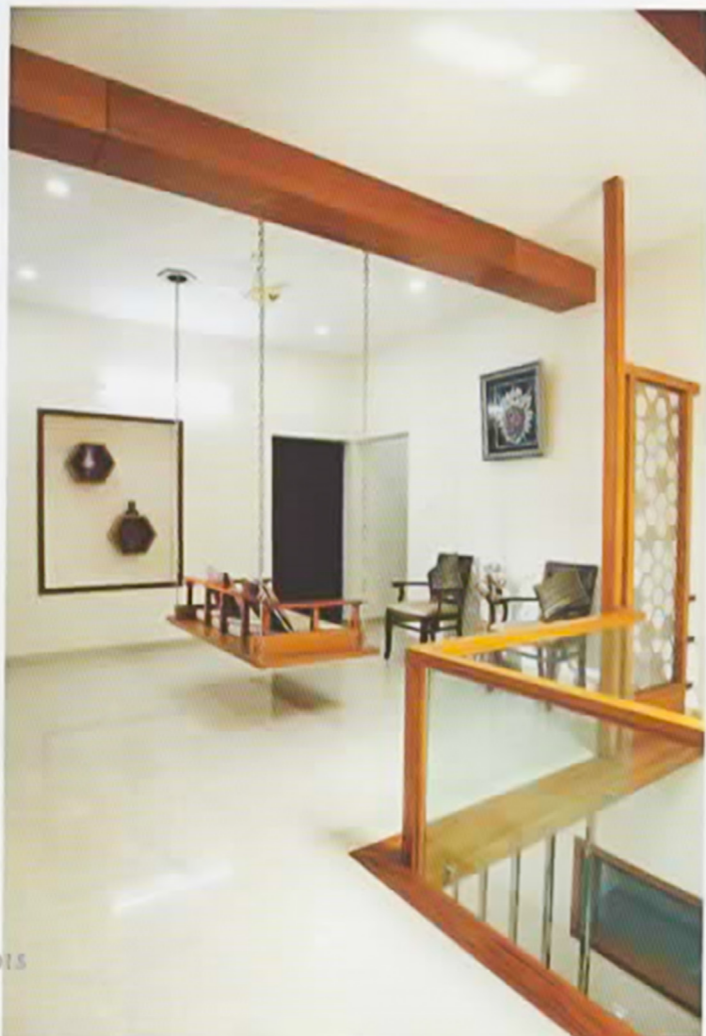
മേമ്പൽ റൂമിന്റെ ഭാഗമായി വരുന്ന ലിവിംഗ് ഏരിയ.

ഫാമിലി ലിവിംഗിന് അഭിമുഖമായി കിടക്കുന്നതാണ് ഡൈനിംഗ് യൂണിറ്റ്. കൺട്രോൾ ഡിസൈൻ